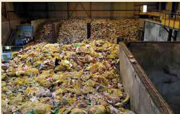
Centre de tri Venesys du Syssem à Vannes

Après une baisse progressive jusqu'en 2019, tous les ratios techniques sont repartis à la hausse en 2020 puis en 2021. Dans le tableau ci-dessous, on constate que les ratios de notre territoire demeurent supérieurs à la moyenne bretonne. C'est particulièrement le cas pour les ordures ménagères résiduelles (OMR), les apports en déchèteries et le verre. ●