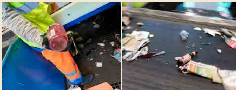
Photos de verre sur les tapis de tri au centre de tri VENESYS. En 1h au centre de tri, on collecte en moyenne 9kg de verre sur les tapis de tri.

Ce verre « mal trié » est dangereux pour les agents du centre de tri VENESYS. A l'UVEOR, il nuit à la qualité des composts produits. Ce verre non trié coûte très cher à la collectivité ! Le SYSEM a calculé que le coût supplémentaire de traitement et d'enfouissement du verre représentait 140 000 € par an. Ce coût comprend le traitement des refus de l'UVO en installation de stockage de déchets non dangereux de Séché à La Vraie-Croix (56). Le coût est répercuté aux foyers dans la Taxe d'Enlèvement des Ordures Ménagères (TEOM) ou la Redevance Incitative (à Questembert Communauté). ●